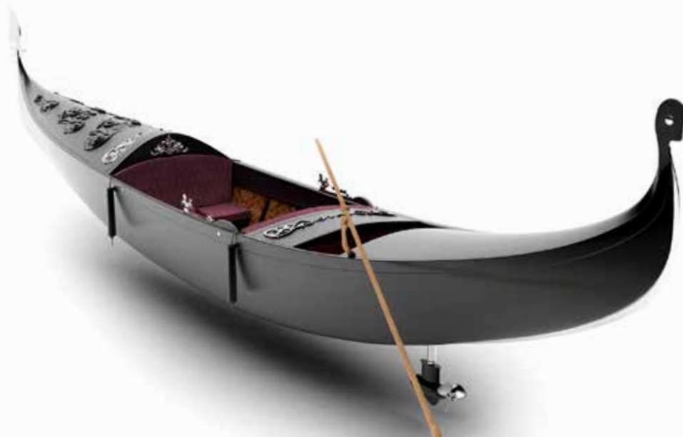
Euro Offshore in Werkendam bouwt acht gondels (van polyester) in Venetiaanse stijl voor het themapark.

te laten 'lopen'. Bij Wijk Yacht Creation zijn ze inmiddels alweer verder en gebruiken augmented reality op tablets. Het werkt verbluffend: je houdt de tablet boven een printje en vervolgens gaat er een interactieve 'film' lopen. Voordeel van zo'n tablet is dat meerdere mensen tegelijk de presentatie kunnen volgen. Van der Wijk moest rekening houden met een aantal typisch Chinese wensen: veel overkappingen omdat mensen niet graag in de zon zitten. Maximale stahoogte en een ruimtelijk opzet, aangezien dat als luxe wordt gezien en ten slotte een afstemming op de stijl van het park.