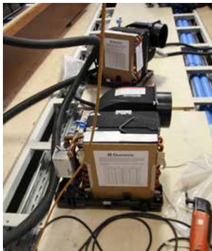
Airco units voor de salonboten worden geleverd door Dometic.